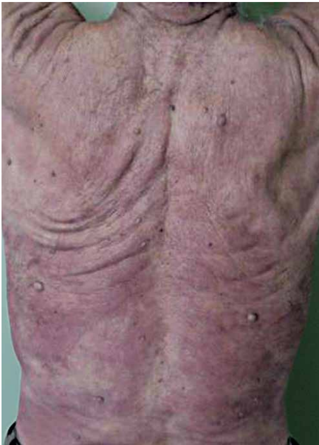
Hanseníase virchowiana: manchas eritematoacastanhadas, mal delimitadas, no dorso

A hanseníase, conhecida antigamente como lepra, é uma doença crônica, infectocontagiosa, de evolução lenta, causada pela bactéria Mycobacterium leprae , que compromete os nervos periféricos, causando alterações sensitivas, motoras e autonômicas em face (olhos e nariz), mãos e pés. Tem como único hospedeiro o homem. A transmissão ocorre por contato próximo e prolongado com doentes não tratados.