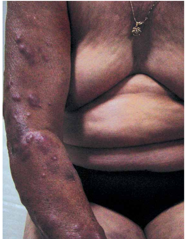
Eritema nodoso hansênico: nódulos inflamatórios de distribuição simétrica nos membros superiores