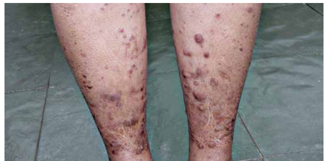
Hanseníase virchowiana: ressecamento da pele e hansenomas nas pernas.