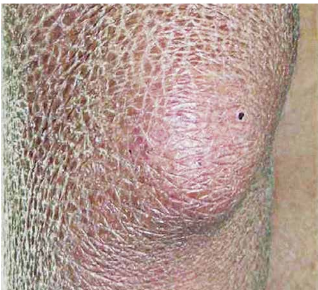
Nota-se tumoração em cotovelo esquerdo, além de xerodermia

A hanseníase tem cura e o tratamento é baseado na sua manifestação clínica em cada indivíduo, podendo ser Paucibacilar (poucos bacilos) ou Multibacilar (muitos bacilos). O tratamento é com a Poliquimioterapia (PQT), uma associação de antimicrobianos, recomendado pela Organização Mundial de Saúde (OMS) e disponibilizado pelo Sistema Único de Saúde (SUS) com o acompanhamento da doença realizado em unidades básicas de saúde e de referência.