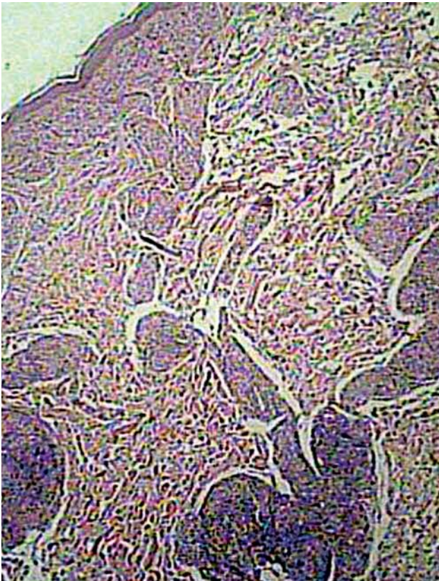
Infiltrado inflamatório linfo-histiocitário, com formação de granulomas, distribuído ao redor do plexo neurovascular e anexos cutâneos.