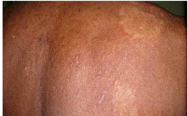
Hanseníase indeterminada: máculas hipocrômicas, mal delimitadas, no dorso