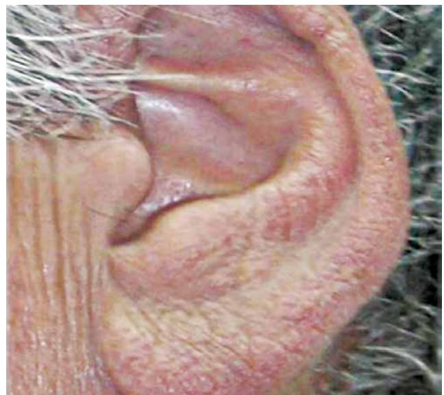
Nota-se infiltração em lóbulo de orelha esquerda